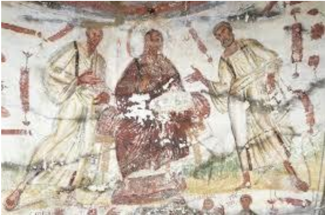
Gravura na Catacumba de Marcelino em Roma, Jesus ao centro;