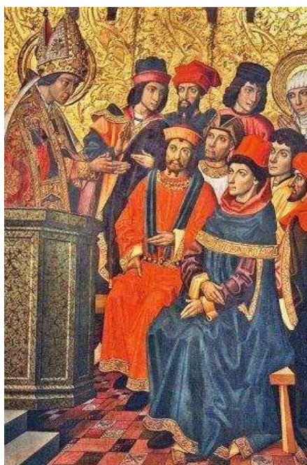
Gravura de Ambrósio pregando.

Levava vida austera, recebia a todos os que o procuravam para conselhos ou ajuda material. Não costumava escrever os sermões, mas falava a partir do que o coração lhe inspirava – e depois compilava as notas que alguém tomava, nascendo daí sua extensa obra escrita.