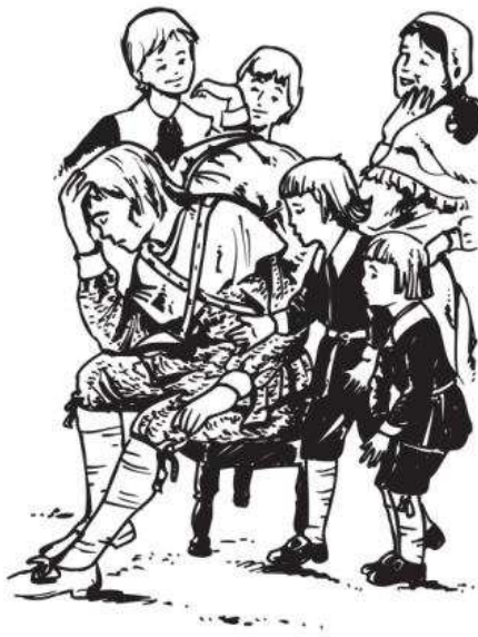
Tratam-no com aspereza

esmaga. Sei com certeza que a cidade em que habitamos vai ser consumida pelo fogo do céu, e todos pereceremos em tão horrível catástrofe se não encontrarmos um meio de escapar. O meu temor aumenta com a idéia de que não encontre esse meio.”