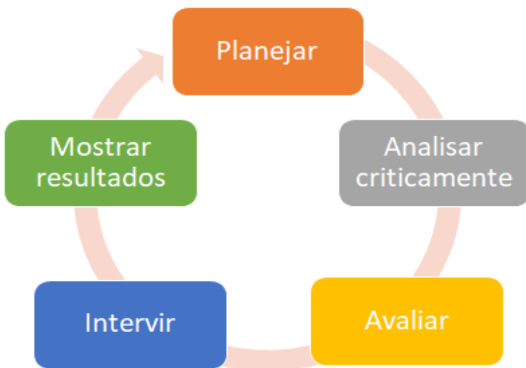
Figura 1 – Processo de sedimentação do conhecimento por meio do PI

Ele sedimenta o conhecimento explícito (formal, explicado, declarado), que pode ser comunicado e formalizado por meio de textos, desenhos, diagramas, etc. Conhecimento que pode ser guardado em bases de dados (computadores), publicações (revistas, livros, documentos) e mídias (vídeos e gravações fonográficas).