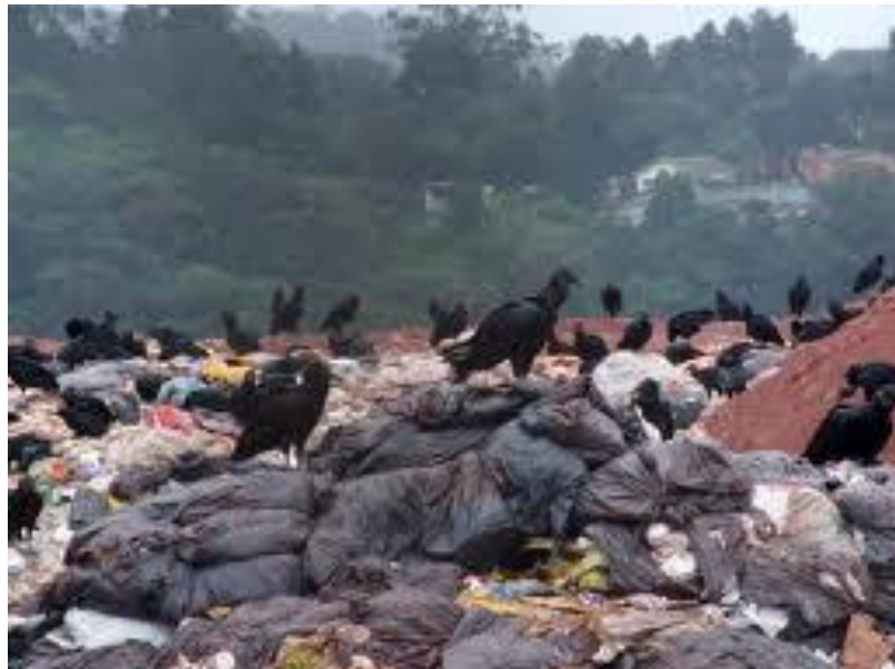
7 - Cabeça do Pica-Pau, maravilha de Deus.

Deus criou o estômago do urubu com características singulares. Ele dissolve até aço. Urubu tem o melhor olfato dentre as aves para detectar podridão, seu olfato como equipamento auxiliar detecta mau cheiro a 50 km e sua visão detecta bicho morto a 3 km. Urubu não come outro urubu morto porque entende que pode ser uma substância muito venenosa para ter matado um colega da espécie. Seu estômago é um laboratório imunológico de última geração para identificar e neutralizar bactérias e vírus nocivos. Seu estômago possui ácidos que destroem botulismo, antrax, tétano. Graças a este equipamento acoplado no urubu que Deus impede que o mundo seja fedido e que doenças oriundas de carnicas se espalhem facilmente. O estômago do urubu equivale ao caminhão de lixo. Ambos foram criados por seres inteligentes. Nenhum laboratório da indústria farmacêutica conseguiu produzir uma blindagem no estômago. Mas Deus criou e colocou nos urubus.