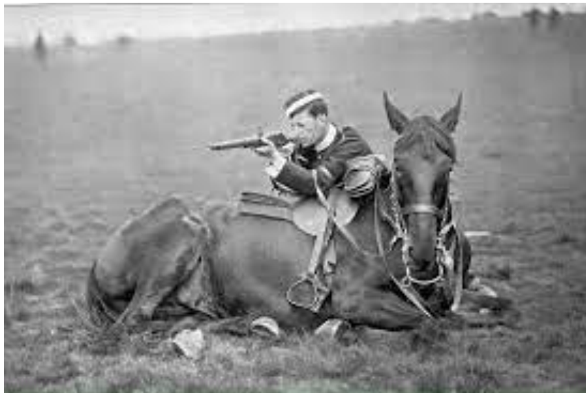
6 - Estômago do urubu, maravilha de Deus.

O maior companheiro do homem na história não foram os cães, mas os cavalos. Eles com sua força nos ajudaram a construir nações, derrubar impérios. Em quase todas as guerras eles participaram levando suprimentos e guerreiros. No livro de Jó Deus elogia o cavalo por sua coragem de enfrentar a espada na guerra (Jó 39.19-25). Os cavalos são tão fortes que se tornaram símbolos de força no estudo da física (HP e CV) para medir a potência dos motores. A Bíblia fala de cavalos no céu (Apoc 19.11-15). Cerca de 8 milhões de cavalos participaram na 1ª Guerra Mundial. Só da Inglaterra foram 1 milhão aos campos de batalha e quase todos morreram por nós humanos. Se um cavalo é tratado com carinho, ele vai lembrar dele como amigo para sempre. Deus os criou para ser nossos parceiros, por isto os seus ouvidos são os mais aptos para ouvir a voz humana diz a Dra. Carol Sanjey da Universidade de Rennes.