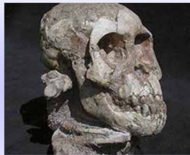
Crânio de Lucy

A mais conhecida ossada de Australopithecus foi encontrada em 1974 na Etiópia. Ela tinha 3,5 milhões de anos. Era uma fêmea adulta e recebeu o nome de Lucy em referência à música dos Beatles “Lucy in the Sky with Diamonds”, o maior sucesso da época.