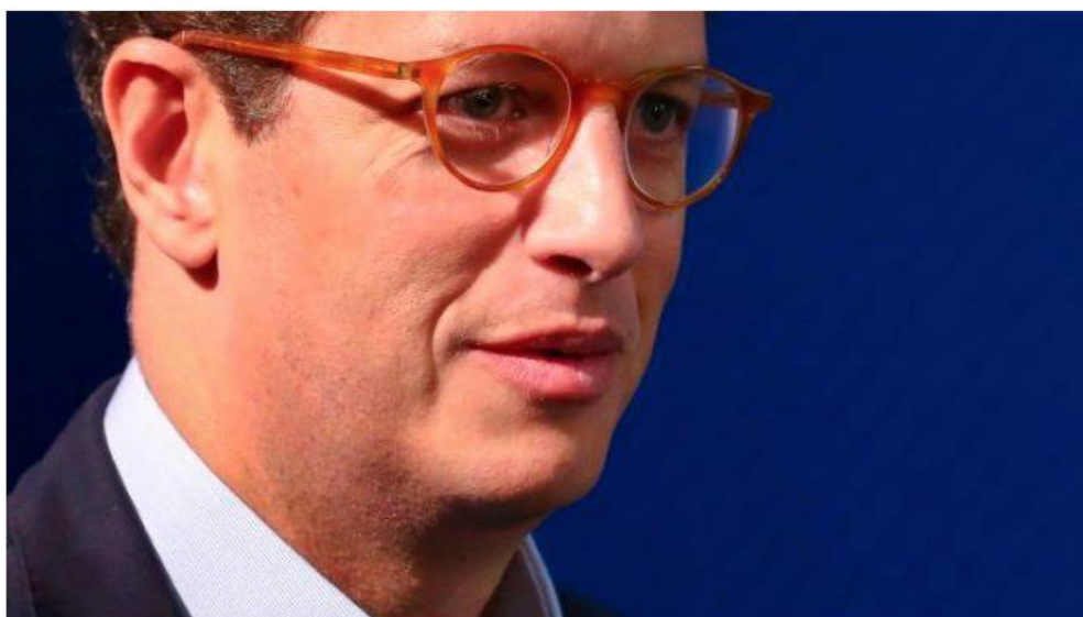
Ministro do Meio Ambiente, Ricardo Salles.

Os "moderados", os "liberais", os de "centro", no afã de responsabilizar Bolsonaro por tudo de ruim que acontece no país, passaram pano para os abusos escandalosos do Supremo Tribunal Federal, deixaram de apontar para o sensacionalismo esquerdista da imprensa, e chegaram ao ápice de normalizar até figuras radicais como Ciro Gomes. Quem pode levar a sério quem chama Bolsonaro de radical ao lado do Ciro?