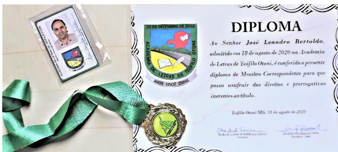
Diploma de membro correspondente da Academia de Letras de Teófilo Otoni