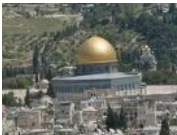
Gerusalemme, la città principale menzionata nella Bibbia.