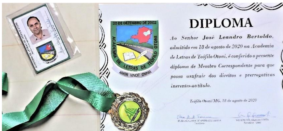
2020. Diploma de membro correspondente da Academia de Letras de Teófilo Otoni