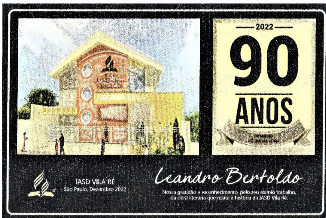
Placa personalizada comemorativa dos 90 anos da IASD de Vila Ré.

A honraria foi criada especialmente para aquela ocasião e visava agradecer algumas pessoas que prestaram serviços proeminentes à IASD Vila Ré. Ainda, materializando o sentimento de gratidão da congregação, o homenageado recebeu de presente uma preciosa camisa social.