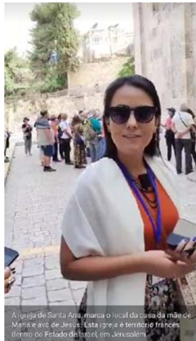
A igreja de Santa Ana, marca o local da casa da mãe de Maria e avô de Jesus. Esta igreja é território francês dentro do Estado de Israel, em Jerusalém.