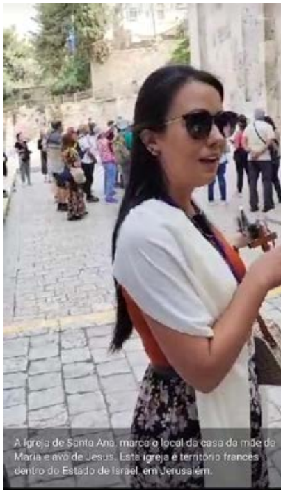
A igreja de Santa Ana, marca o local da casa da mãe de Maria e avô de Jesus. Esta igreja é território francês dentro do Estado de Israel, em Jerusalém.