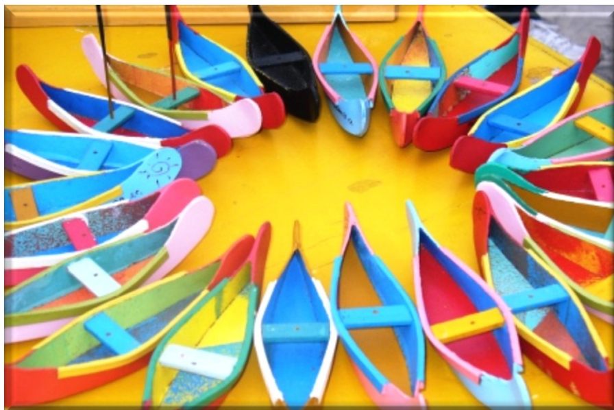
ARTESANATO DA ILHA - PÂNTANO DO SUL RESTAURANTE DO ARANTE