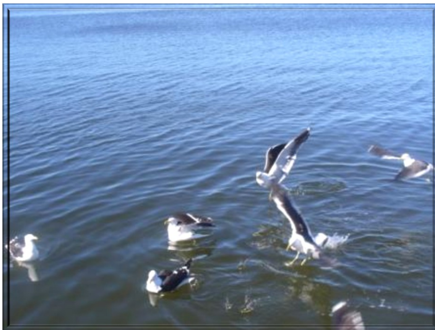
LAGOA DA CONCEIÇÃO - CANTO DA LAGOA RESTAURANTE DECA